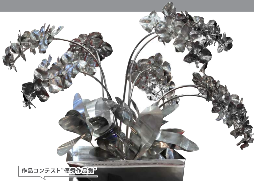
作品コンテスト“優秀作品賞”